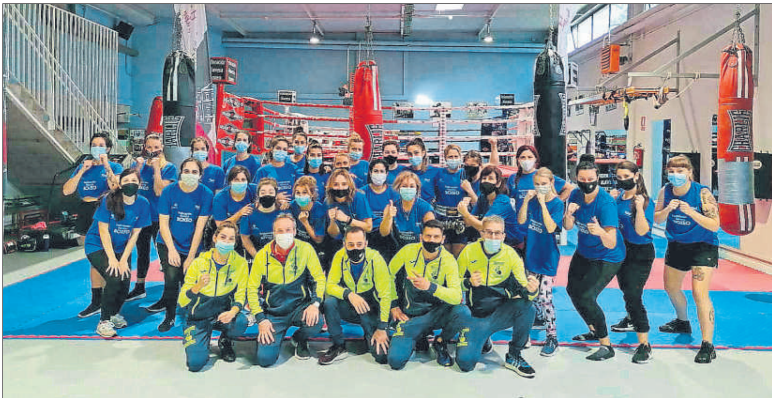
Jornada exitosa Mendizorrotza acogió una jornada de boxeo femenino el pasado 1 de noviembre

Después, el pasado 7 de noviembre se disputaron las eliminatorias del Campeonato de Euskadi de boxeo olímpico en categoría élite masculina, cuyas finales tuvieron lugar el pasado sábado, día 14, en el polideportivo gasteiztarra de Judimendi. “Son campeonatos que estaban previstos para abril. Pensamos hacerlo en verano, pero como las restricciones se levantaron en junio nos pareció un poco precipitado y, viendo que el Cam-