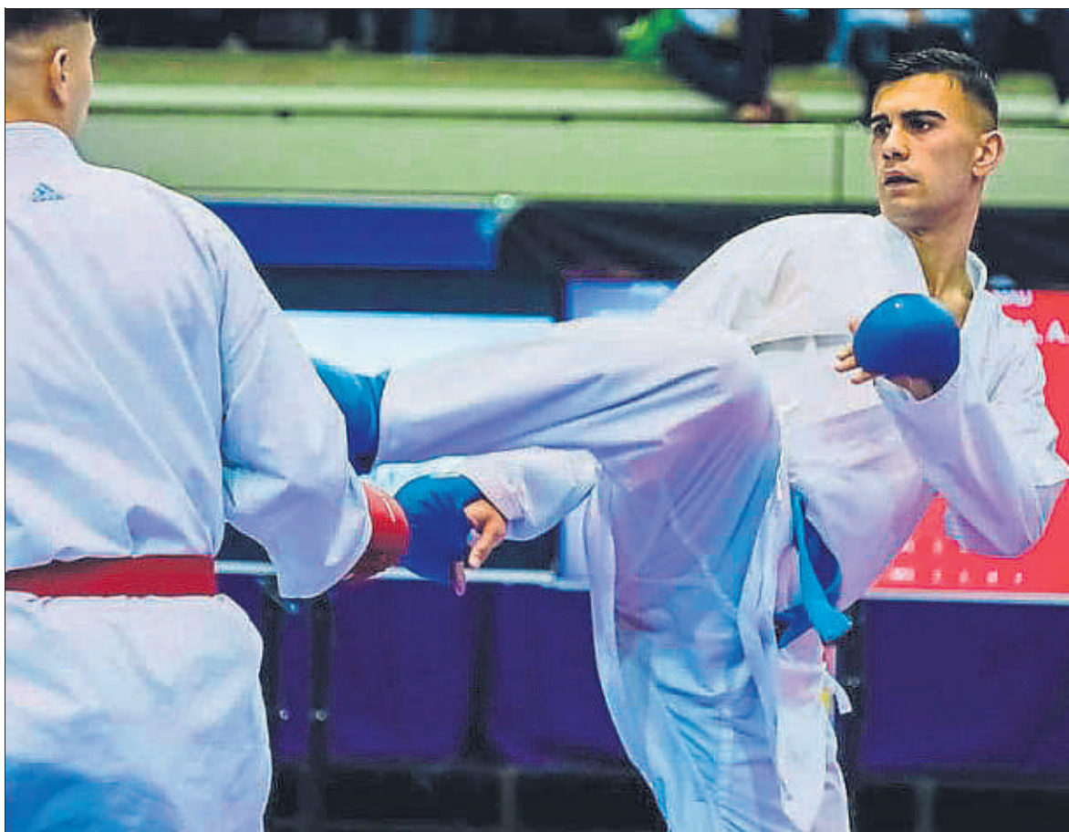
Objetivo La Federación quiere que sus deportistas compitan cumpliendo estrictamente los protocolos sanitarios marcados por la Covid-19

“Queremos lanzar un mensaje de que con prudencia se puede competir”, dice Colás